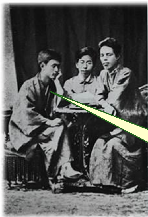
新渡戸稲造・宮部金吾・内村鑑三