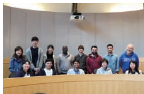
ブリティッシュ・コロンビア大学