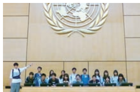
スイス・ジュネーブ大学(WHOなど)