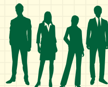
グローバル・リーダー

「フロンティア精神」、「国際性の涵養」、「全人教育」および「実学の重視」という北海道大学の4つの基本理念に加え、新渡戸カレッジ生の「リーダーシップ力」を涵養するために、次の5つの方針の教育を行います。